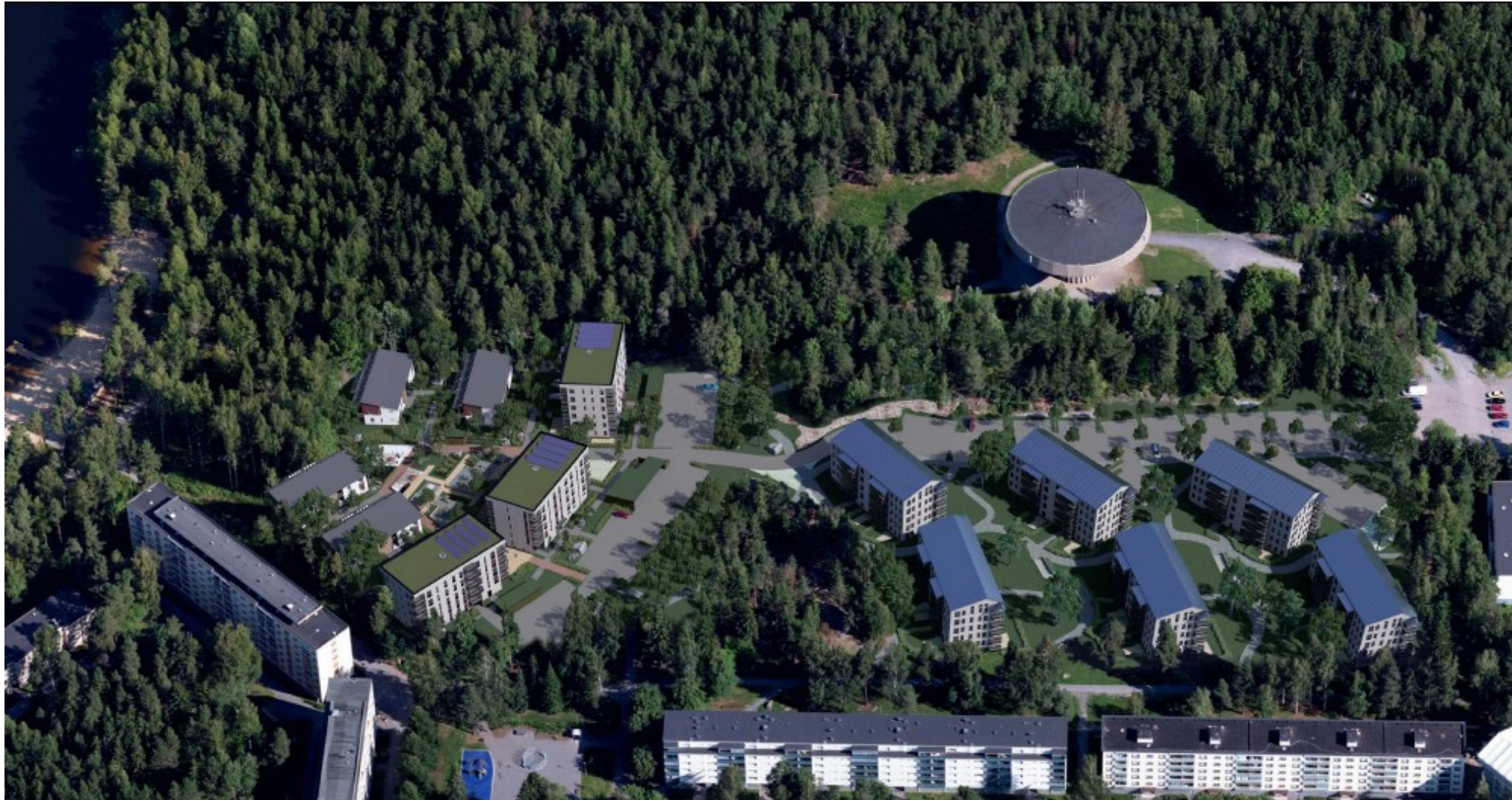
Viistoilmakuva suunnitelmasta ympäristöineen (Arkkittehtoitomisto Arkkigraf)