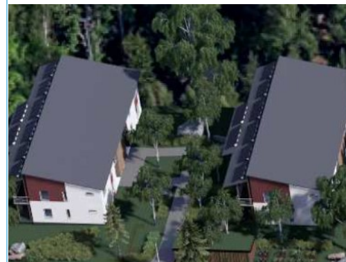
Viisualisointikuvat Arkkitehtitoimisto Arkkigraf