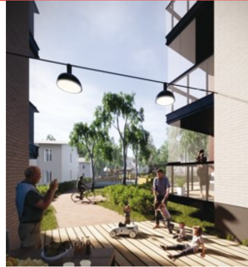
Rantakorttelin sauna- ja oleskeluterassi kerrostalojen välissä.

MÄÄRÄYS: Korttelialueen puistoon rajautuva piha-alue tulee toteuttaa korkeatasoisena rakennuksen pohjakerroksen toimintoja tukevana alueena, ottaen huomioon kevyenliikenteen sekä huoltoliikenteen tarpeet.