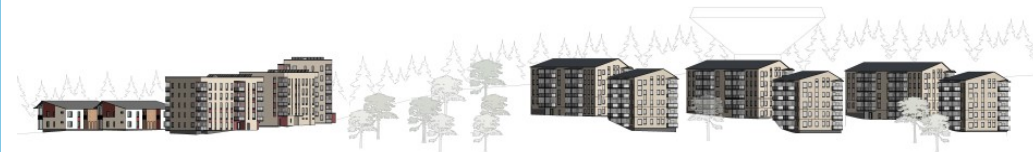
Havainnollistava kuva etelän suunnasta. Arkkitehtitoimisto Arkkigraf