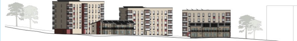
Rantakortteli lounaasta ja luoteesta. Arkkitehtitoimisto Arkkigraf.