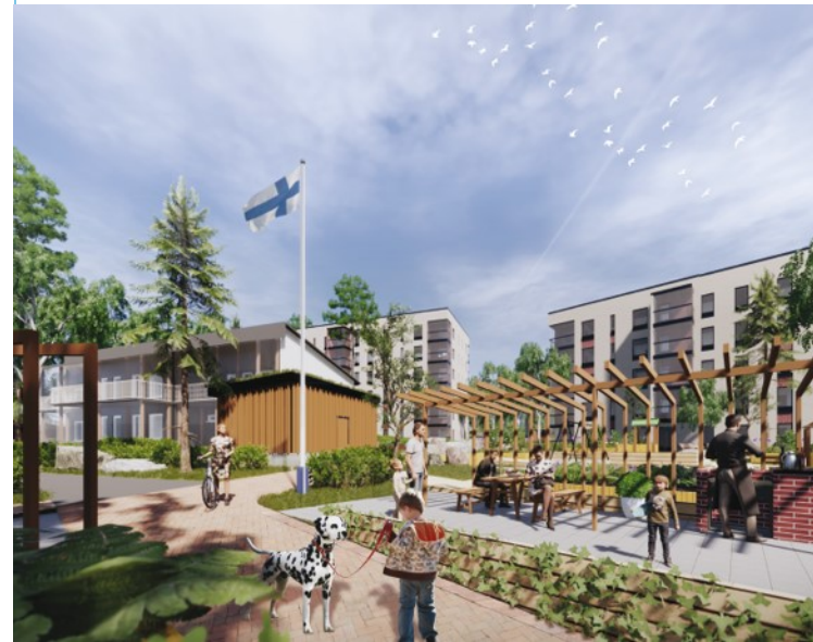
Rantakorttelin yhteispiha korttelin tulosuuntaan.