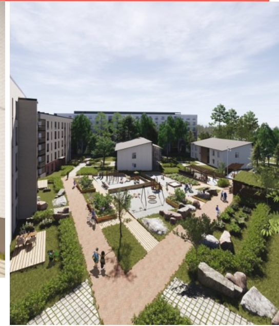
Rantakorttelin yhteispiha Tesomajärven suuntaan.